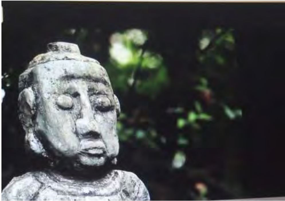
tabajara busshi, brazil