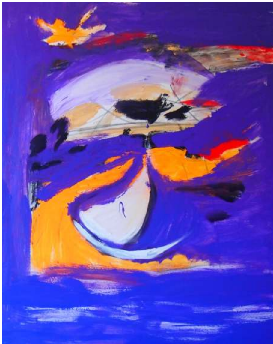
die blaue stunde